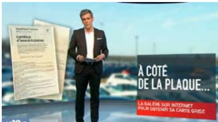
01 Reportage vidéo M6, le 19/45 - jeudi 29 mars 2018