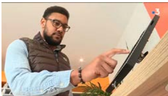
02 Reportage vidéo France 3