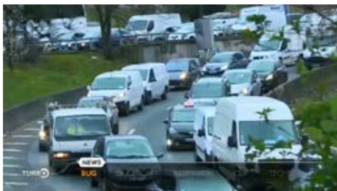
03 Reportage vidéo M6, Turbo - 8 avril 2018