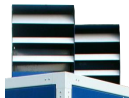
Tête de soufflage