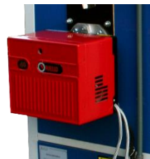
Bruleur fioul RIELLO