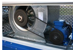
Groupe électro ventilateur