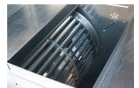
Chambre combustion INOX