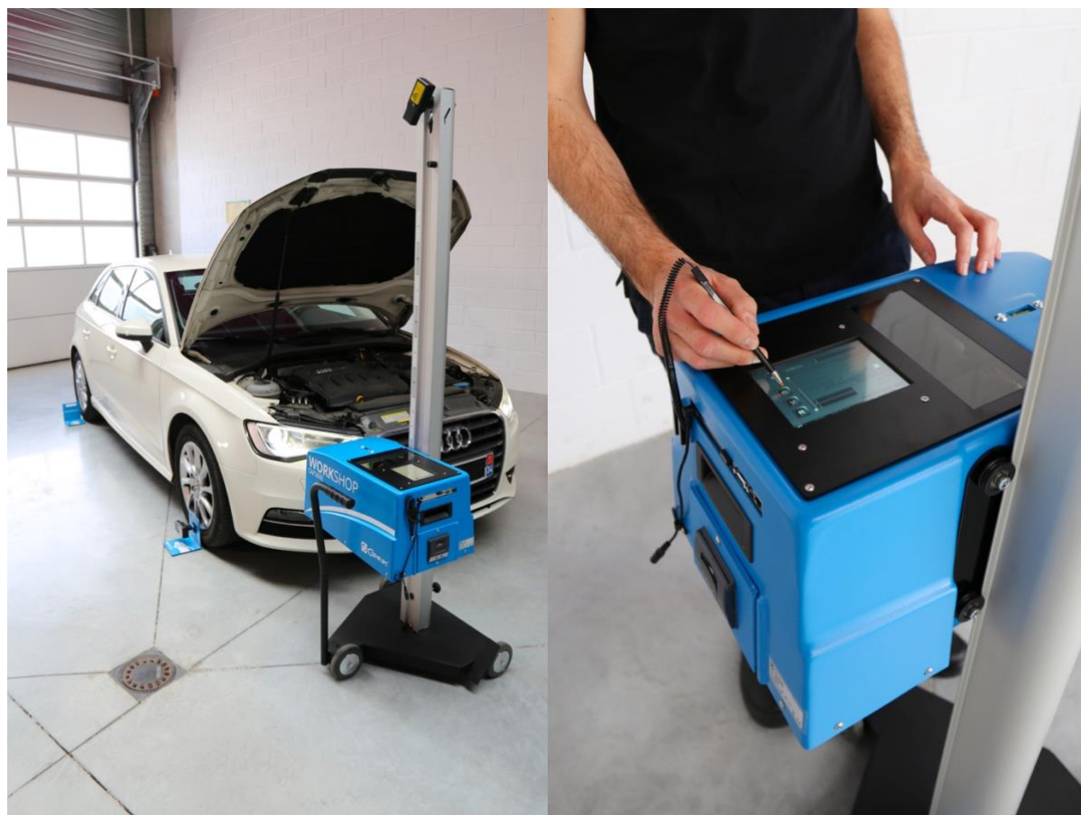
Le nouveau reglophare CAP2600Workshop : la solution performante destinée aux ateliers.

Conçu par les ingénieurs du bureau d'études Capelec à Montpellier, le reglophare expert CAP2600WORKSHOP affiche un concentré d'innovations : diagnostic de sécurité des éclairages, édition de rapports de pré et post-diagnostic, mise en œuvre multizones et compatibilité à la technologie Matrix.